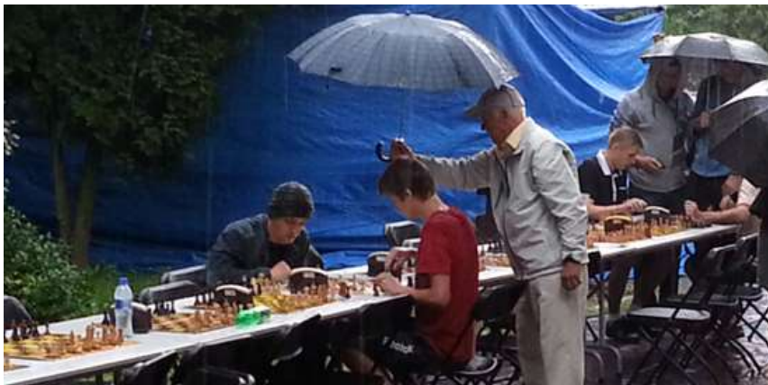
Święto Kielc 2013